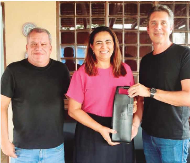
Diretoria da SRM reforça parceria do Governo para mais uma Expoingá