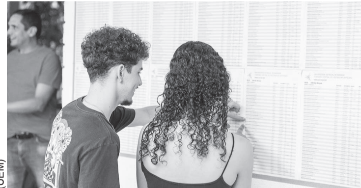
UEM divulga a lista de aprovados no Vestibular de Verão e no Processo de Avaliação Seriada (PAS) 2024

As provas aconteceram no último dia 12 de janeiro, com a participação de mais de 7,1 mil candidatos que disputaram 892 vagas em 70 cursos de graduação da UEM. Já o PAS, realizado no dia primeiro de dezembro de 2024, contou com a inscrição de mais de 22 mil candidatos, sendo 3,2