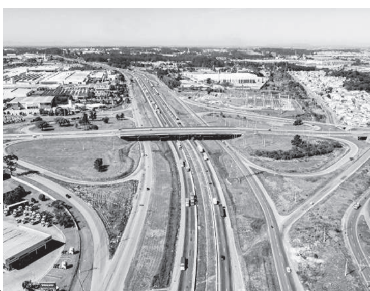
Os deputados protocolaram documento na ANTT pedindo a reavaliação da cobrança de pedágio no sistema “free flow”

De acordo com os autores do documento, a cobrança de pedágio por meio eletrônico em rodovias que passam no perímetro urbano vai trazer impactos econômicos e sociais negativos aos moradores de municípios onde as estradas se transformam em avenidas e vias