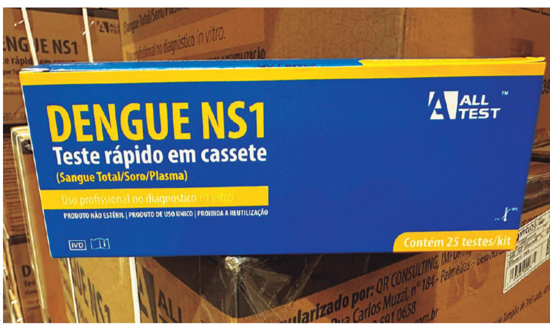
Esse quantitativo será distribuído para as 22 Regionais de Saúde do Estado já nos próximos dias

Esse quantitativo será distribuído para as 22 Regionais de Saúde do Esta-