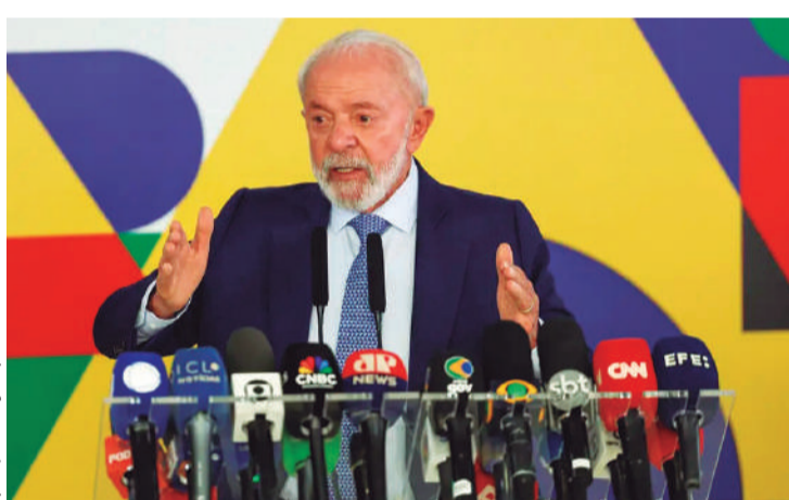
Presidente celebrou acordo entre governo e bancos para usar plataforma

A ideia do governo é criar uma plataforma que permita aos bancos e instituições financeiras acessar diretamente o perfil de