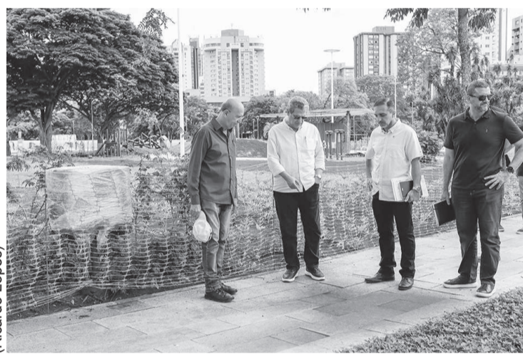
Equipe da Secretaria de Obras Públicas, acompanhada pelo prefeito Silvio Barros, fez visita técnica nas obras do Eixo Monumental na Praça da Catedral

No decorrer da visita foi avaliada o assentamento do piso, as instalações dos quiosques, o parque infantil, a preparação da fonte interativa e os sistemas de drenagem de