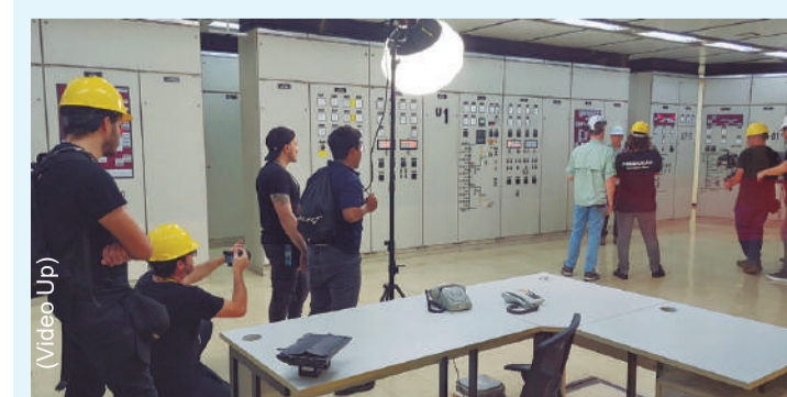
Primeiro episódio “Itaipu Binacional – 50 anos de história” vai ao ar neste sábado

Além da RIC, a série também pode ser vista no Youtube pelo link http://bit.ly/3W9dTil . No Globoplay, o link é https://bit.ly/4fO1cR0 . Mesmo quem não assina o streaming têm acesso aos episódios, que fazem parte do conteúdo aberto. (ASC)