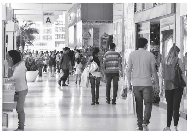
Apesar do desafio no momento atual, consumidores se mostram confiantes

O ICF é um indicador que mede o potencial das vendas do comércio, apurado mensalmente pela CNC. Os resultados medem o grau de satisfação e insatisfação dos consumidores. Quando o índice, que vai até 200 pontos, está abaixo de 100 pontos, indica insatisfação. Já quando está acima de