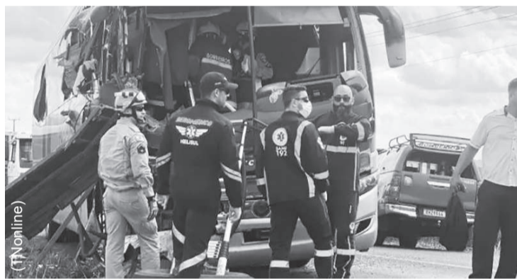
O ônibus transportava trabalhadores de uma cooperativa de alimentos

Ônibus transportava trabalhadores de uma cooperativa de alimentos quando bateu de frente com um caminhão na saída de Bom Sucesso para São Pedro do Ivaí ontem à tarde.