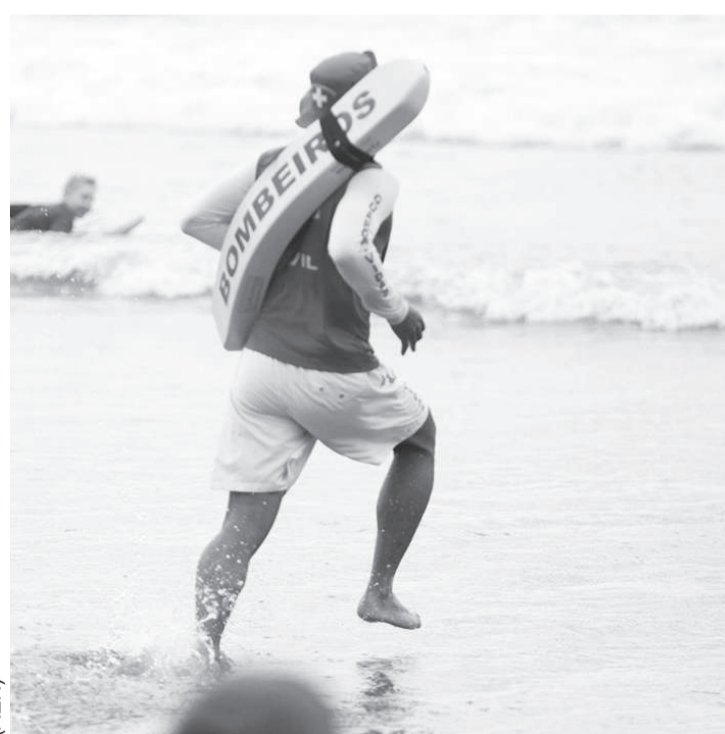
Os salva-vidas do Corpo de Bombeiros estão tendo muito trabalho nas praias paranaenses

A atuação dos bombeiros para ampliar cada vez mais as medidas preventivas – ou seja, minimizar a ocorrência de incidentes aquáticos neste período de altas temperaturas – se reflete nos números. No período incluído no relatório, os bombeiros em ação nas praias do Paraná