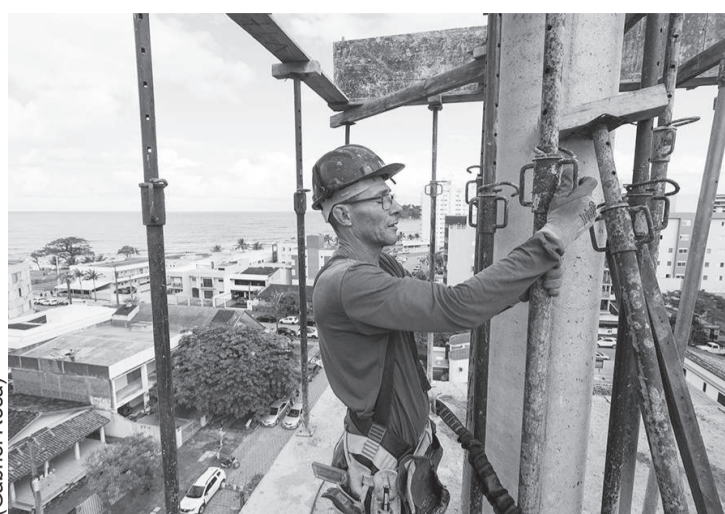
Paraná fecha 2024 como quarto estado que mais gerou empregos no Brasil

Além disso, o Paraná chegou a um estoque de 3.218.470 pessoas empregadas com carteira assinada. Na comparação com os dados de 2023, o crescimento no estoque de empregados foi de 4,14%, uma variação superior a estados como São Paulo (3,31%), Rio de Janeiro