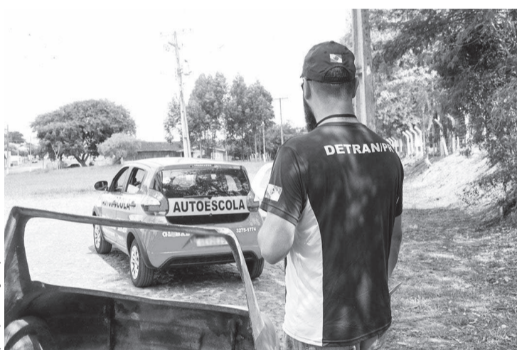
A medida permite que as autoescolas utilizem carros equipados com dispositivos tecnológicos

Entre as tecnologias que passam a ser autorizadas estão câmeras de ré, sensores de estacionamento, sistemas de alerta de cinto de segurança, assistente de